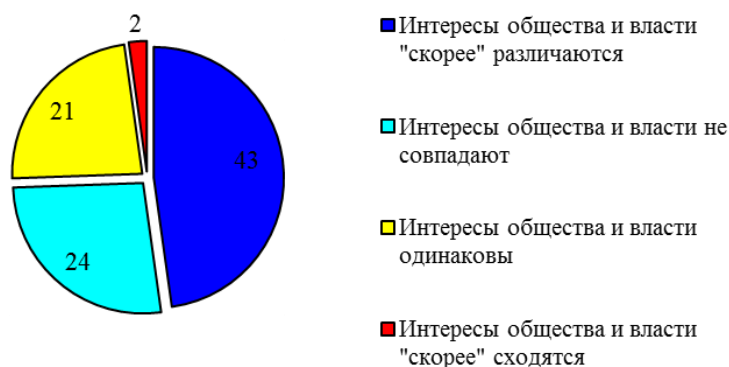
Рисунок 3. – Социологический опрос относительно заинтересованности власти в решении актуальных вопросов граждан [8].

население, потому что живет за его счет». Социологи полагают, что у населения есть сильное чувство «невозможности повлиять на власть».