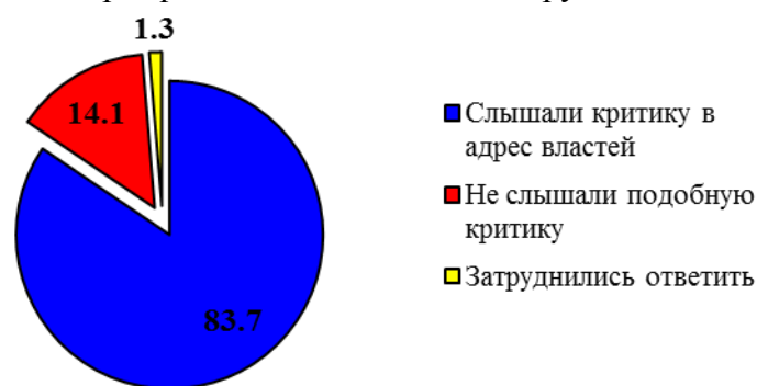
Рисунок 1. – Социологический опрос о критических высказываниях в адрес властей [1].

Основная часть. Сегодня можно с уверенностью сказать о том, что обычному человеку при появлении какой-либо проблемы гораздо удобнее и привычнее критиковать, возмущаться и, в конечном счете, смириться со сложившимися трудностями. В подтверждение этому на рисунке 1 приведены результаты социологического опроса, в котором приняли участие 1240 человек [1]. Указанный опрос показал, что значительное число опрошенных слышали критические высказывания в адрес российских властей от окружающих.