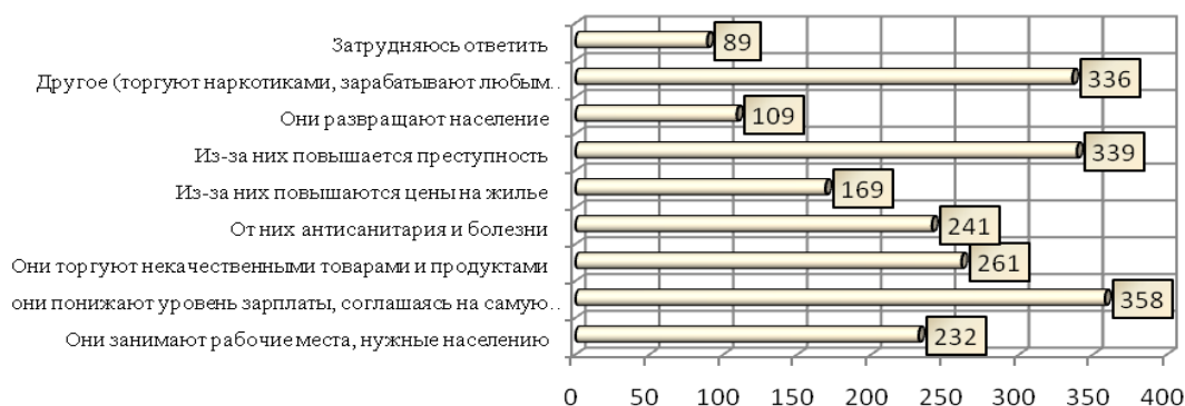
Рисунок 2. Результаты анкетирования при ответе на вопрос: «Что отрицательного Вы видите в присутствии мигрантов в Вашем городе?».

Главными негативными последствиями миграции являются инициирование межнациональных конфликтов (413 человек), повышают преступность (390 человек), увеличивают безработицу (299 человек). На вопрос нужно ли ограничивать миграцию почти 600 человек ответили: «да». Это еще раз подтверждает негативный настрой населения. Результаты по вопросам о связях можно сделать вывод о том, что люди в основном не имеют никаких связей с мигрантами или просто знают их, а друзей-мигрантов имеют немногие. Опрашиваемые считают, что мигранты работают там, где не хотят работать местное население, и это, по их мнению, является главной положительной чертой. Других ответов примерно одинаково.