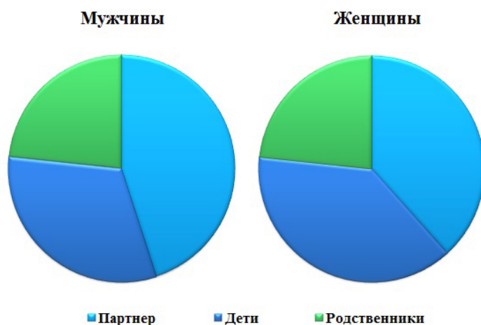
Рисунок 2. – Различия в иерархии подкатегорий сферы семьи.

В отношении различий в иерархии подкатегорий в сфере семьи следует отметить, что у женщин партнёрские отношения с мужчиной в представлениях о будущем настолько же значимы, как и дети, а у мужчин отношения с женщиной-партнёром явно превалируют и стоят на первом месте, в то время как дети занимают выраженное второе место (рисунок 2).